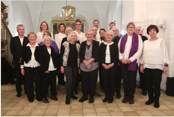
Sct. Peders Kirkes Voksenkor.