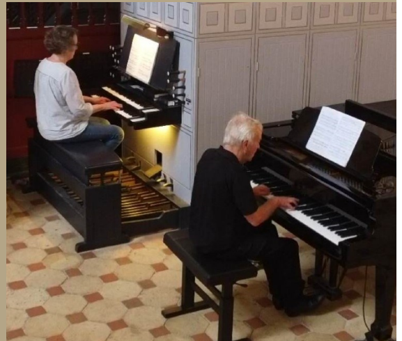
Duo in Concerto.