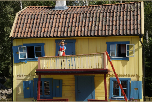
Villa Villakulla i Småland.