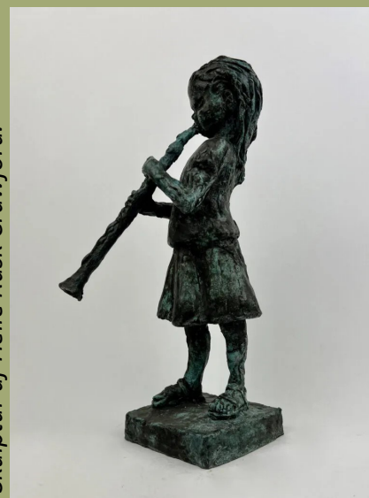
Skulptur af Helle Rask Crawford.

Der er gratis adgang for gæster under hele udstillingen.