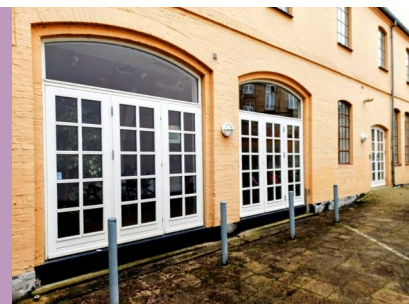
Parterre.